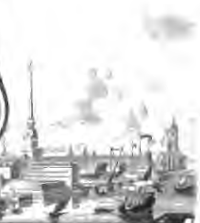
ЗИМНИЙ ДВОРЕЦЪ И ГЛАВНОЕ АЗМИРАТТЪ СТОИ въ 1753 г.