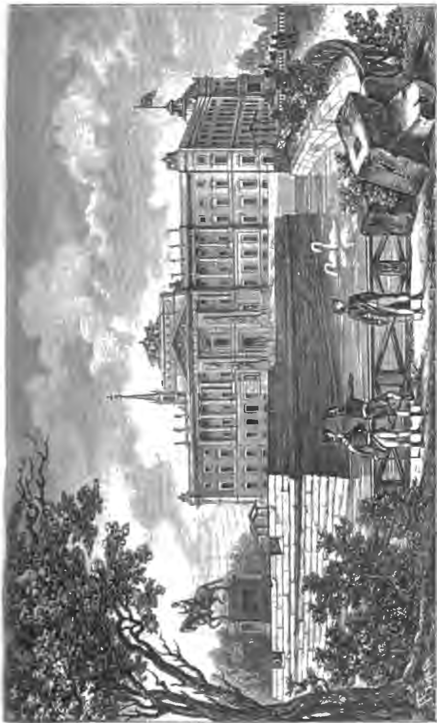
ВИДЪ МИХАЙЛОВСКАГО ЗАМКА ВЪ 1800-1801 ГГ.